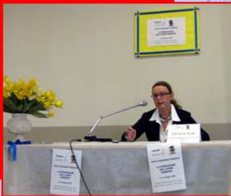
Prof.ssa Nicoletta Pavesi Università Cattolica di Milano Partecipazione sociale in una società pluralista