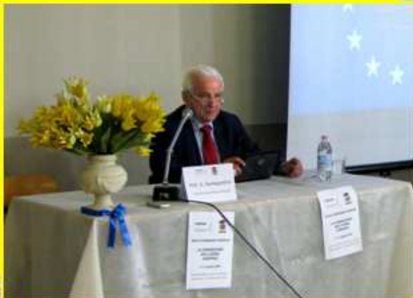
Prof. Angelo Santagostino Università degli Studi di Brescia La formazione dell'uomo europeo: cultura e identità