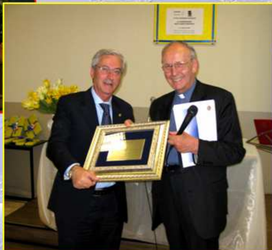
Il Presidente Federuni ringrazia il Governatore per l'organizzazione del Congresso